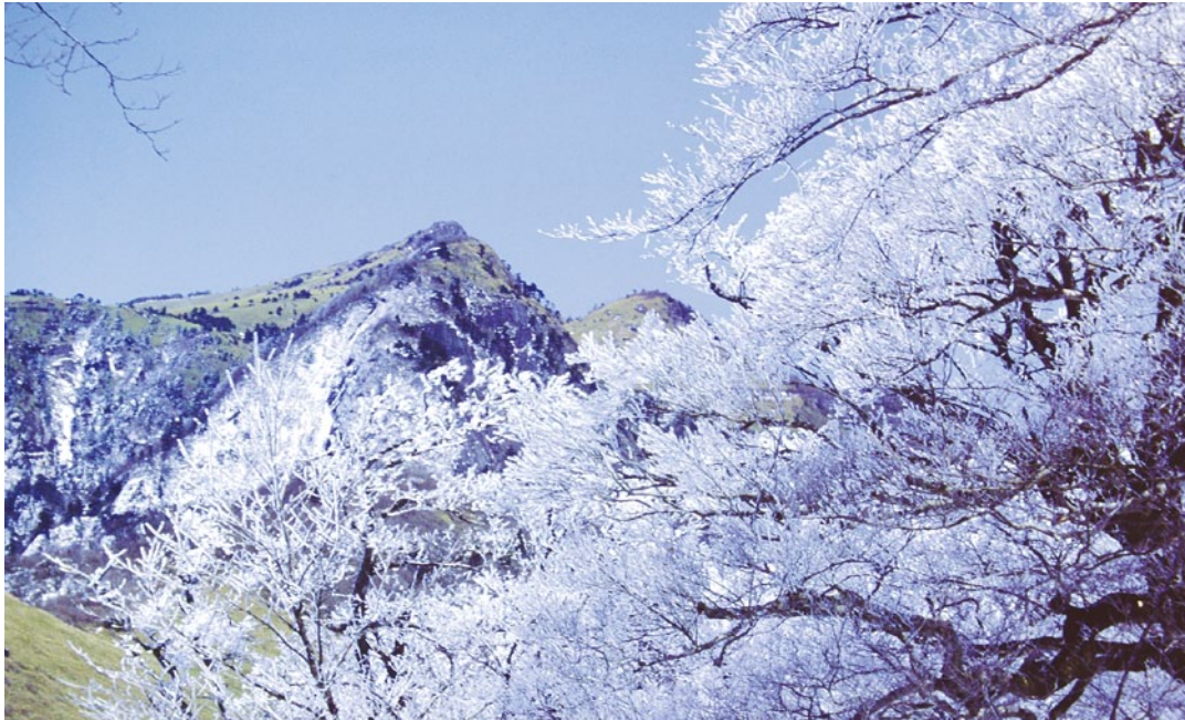
いの町の子持権現山