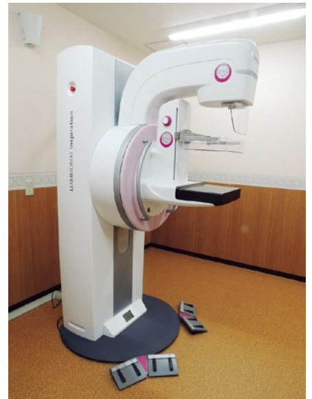
細木病院のデジタル・マンモグラフィ (デジタル式乳房用X線診断装置)

乳がんの早期発見、早期治療には、定期的な乳がん検診が欠かせません。当院の乳がん診療は、検診から診断、治療、生活サポートまで、医師だけでなくコメディカルとチームを組み、患者さんを支えています。マンモグラフィ検査では撮影技術認定を受けた女性技師3名が検査を担当しています。治療においては、術後は理学療法士によるリハビリが充実しており、化学療法はがん化学療法看護認定看護師によるケア体制が整っています。緩和期には緩和ケア病棟スタッフによる寄り添った専門的ケアが行われます。また、生活支援が必要な方には医療ソーシャルワーカーが介入しサポートを行っています。この充実したチームで診療できることに感謝しながら、今後は専門医として、当院の乳腺診療がさらに発展していけるよう精進していきます。その他、乳がん以外の疾患、特に乳腺の炎症や良性腫瘍も、適切な治療を行うにあたり、専門的知識が必要とされますので、乳腺でお困りの方、気になることがある方は、当院外科