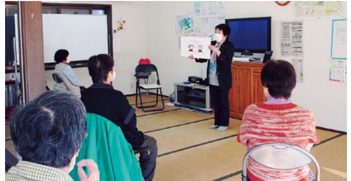
一ノ宮公民館での認知症予防講座の様子

今年の取り組みとしては、住み慣れた地域で暮らし続けることができるよう、地域の集まりなどで、認知症予防や高齢者虐待予防の講座を行っています。認知症については、参加者にクイズ形式でお考えいただくのですが、「どうだろうね～」と互いに顔を見合わせたり、ご自身の経験やご近所の気になる方について教えていただいたりする場面があります。これは、社会保障の自助（一人ひとりが努力すること）、共助（住民・地域全体で地域づくりに向け努力すること）、公助（行政機関などが提