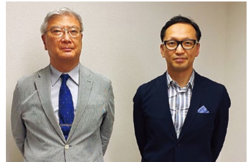
高松和永先生（左）と筆者

の考えもお話ししてきました。コーヒータブレットとして、『ほそぎハートセンター』についてもちゃっかり宣伝してきました。