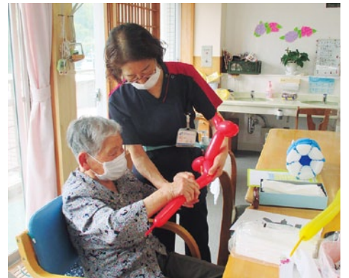
思い切って、ぎゅっ!

で実演を交えて説明して見せるなど、笑顔と拍手で溢れる時間となりました。最後に、利用者さんには、ご自分の作った作品のほかに、鯉のぼりやクマ、ミッキーマウスなどの作品をプ