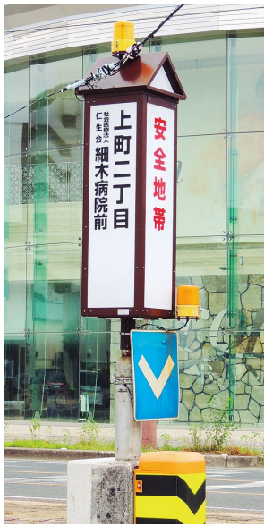
上町二丁目電停大型行灯

細木病院では、電停のネーミングライツ事業に取り組んでいるとさでん交通と、電停「上町二丁目」を対象に3年間の命名権契約を結ぶことになりました。ネーミングライツとは、従来の電停に社名や店舗名、ブランド名などを副呼称として加える形で、新しい停名を命名することです。メ리트として、沿線住民や電車の利用者に対して、当院の場所が認知されやすく、病院のイメージアップにも効果が期待できます。