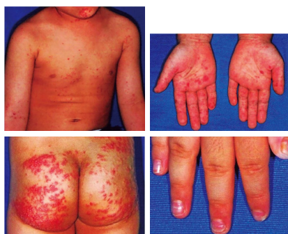
コクサッキーA6型による手足口病 （引用：渡部裕子 up-to-date 子どもの感染症 28~29 vol.4 no.1 2016）

学校保健安全法では手足口病は第二種のその他の感染症に分類され、出席停止期間については明確な規定はなく、「病状により学校医またはその他の医師において感染の恐れがないと認められるまで」とされています。厚生労働省の保育所における感染症対策ガイドラインでの登園の目安は、発熱や口内粘膜疹の影響がなく、普段の食事ができ、下痢がないこととされています。