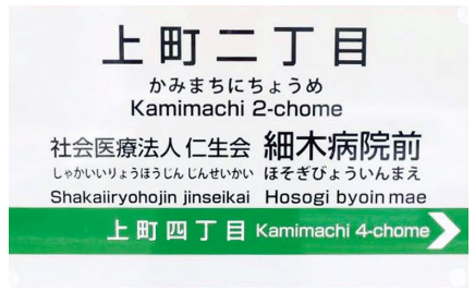
上町二丁目電停案内板

5月31日、電停の行灯が大型のものに付け変えられ、従来の名称「上町二丁目」に加えて「社会医療法人 仁生会細木病院前」の文字が流れて表示、案内され、車内アナウンスも流れています。