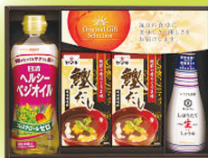
食品 バラエティセット