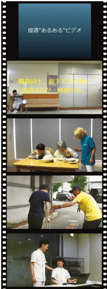
『接遇「あるある」ビデオ』のシーンの一部

細木病院の接遇向上チームでは、院内接遇インストラクターの認定を受けた職員12名が、「身だしなみ・笑顔・態度・挨拶・言葉遣い」の接遇5原則に基づいて、接遇セルフチェックリストの作成や身だしなみチェックミラーの設置、接遇ナイスマン・ナイスウーマンの人選など、職員の接遇向上を目指してさまざまな活動を行っています。