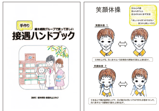
『接遇ハンドブック』のページの一部

「接遇」あるある「ビデオ」を作成し、職員が得意になりたいと思えます。役者になって迷演技を披露し、楽しく撮影を行いました。現在、ビデオを上研修を企画中です。職員一人ひとりが接遇を意識し、信頼される医療の提供と愛される病院づくりを目指して、細木病院グループ全体の接遇向上に貢献できるよ