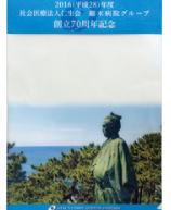
創立70周年記念 クリアファイル