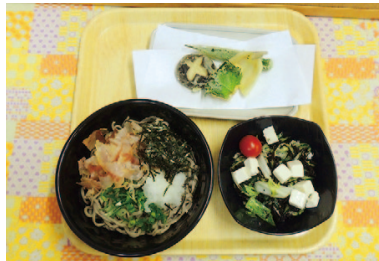
手打ちそばヘルシーランチ

今回、「糖尿病とうまくつきあうために」というテーマで、細木病院における糖尿病に対する取り組みについて、医師、看護師、管理栄養士、理学療法士、臨床検査