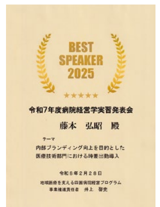
『ベストスピーカー賞』賞状

習を行い、2月末の発表会をもって修了するカリキュラムでした。実習では多くの職員に支えられ、2月の発表会において『ベストスピーカー賞』の栄誉をいただくことができました。実習テーマは「 医療技術部門職員を対象とした複数選択できる勤怠時間の設定とその効果について 」でした。簡潔に説明すると、『(子どもの送迎などの)職員の個人的な都合に対して「時差出勤」を導入することは、職員にとって得なことが多く、業務効率もよくなりますよ』という取り組みの発表です。まだまだこれから改善の余地がたくさんある活動ですが、職員の働きやすさが職場環境の改善につながり、患者さんに対する温かみのあるサービスに転換されればと考えております。