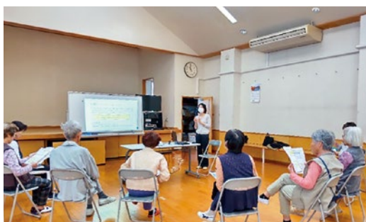
身体を動かしながら楽しく受講

対象となる方々も多様で、65歳から90歳代の高齢者の集まりはもちろん、働き盛りの企業の皆さまの健康意識向上のための講座も行っています。地域で行われている「100歳体操」の集まりに伺うこともあり、日頃の健康づくりに役立つ情報を気軽に学べる場として喜ばれています。参加人数は5名ほどの小規模な会から、120名規模の大きな会場まで、依頼があればどこへでも伺う姿勢を大切にしています。「少人数だからこそ質問しやすかった」「専門職と直接話せて安心できた」といった声