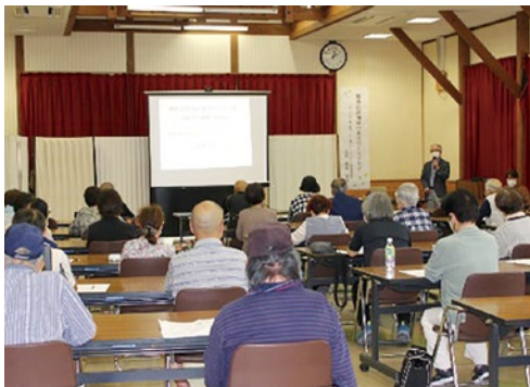
広い会場で大盛況の講座

当院では、地域貢献活動の一環として、医師・看護師・臨床心理士など多職種による「出前講座」を無料で実施しています。昨