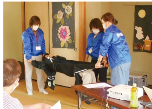
防災関連の講座も人気

出前講座は随時お申し込みを受け付けています。開催日時をご希望に合わせて調整いたしますので、どうぞお気軽にお問い合わせ