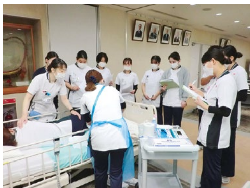
新人看護職員研修の様子

今年も当院に8名の新人看護職員が仲間入りしました。4月から始まった新人研修では、厚生労働省の「新人看護職員研修ガイドライン」を参考に、「安全で質の高い看護を提供できる人材の育成」を目標に、基礎技術の習得からチーム医療の理解まで段階的なプログラムを実施しています。注射・採血・清潔ケアなどの基本技術はシミュレーション機器を用いて繰り返し練習し、確実な手技の習得を目指しました。また、感染対策や医療安全の講義では実例を交え、看護師としての責任や判断力を養っています。