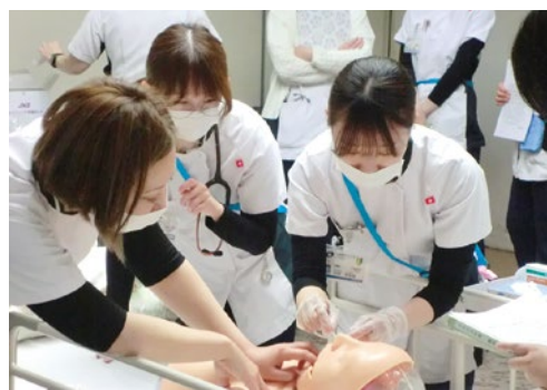
熱心に取り組む新人看護職員

造を意識しながら手技を振り返り、「なぜこのケアが必要なのか」を考えることで、アセスメント能力の向上につなげています。互いに学び合う姿からは、チームとしての成長が始まっていると感じます。