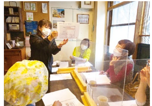
資料を使い丁寧に説明する講師

私たちにとっても、地域の皆さまの声を直接伺える貴重な時間であり、今後の医療提供に生かす大きな力となっています。