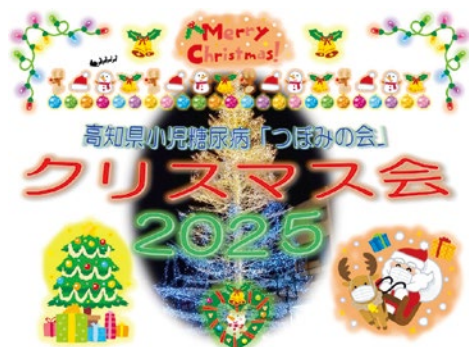
クリスマス会2025タイトル画面

会とも開催できなくなり、患者・家族同士・キャンプスタッフとの交流がないまま、3年以上がたちました。