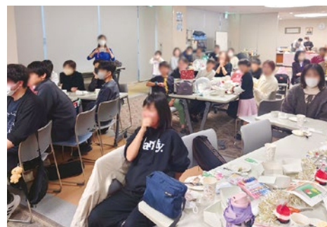
大盛況のクリスマス会