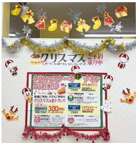
クリスマス商品販促ディスプレイ

ローソン「クリスマス商品」の獲得数が、高知県内で2年連続1位を達成しました。これは、細木病院グループ力で成し得た快挙で、ダントツの1位でした。お買い上げいただいた皆様に感謝申し上げます。これからもご支援（買ってください）のほど、よろしくお願いいたします。