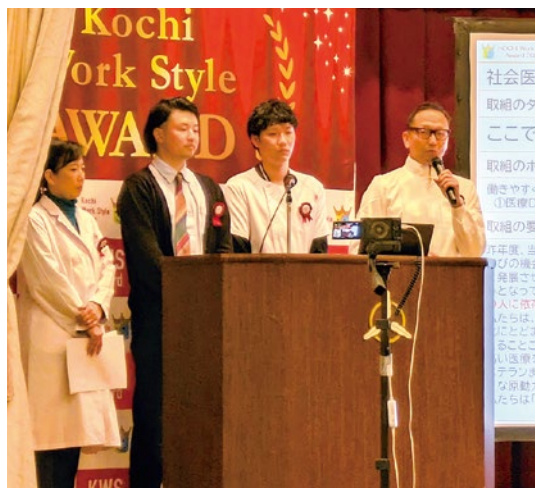
メンバーによるプレゼン