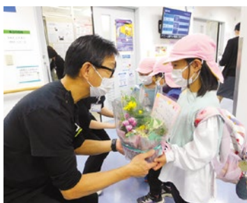
先生！いつもありがとう

勤労感謝の日に合わせて、小高坂双葉園年長組の元気な園児たちが細木病院を訪問。「いつもありがとう！おしごとがんばってね」のメッセージと感謝の花束が、外科尾崎医局長と整形外科中前医師に贈られました。いただいた花束は外来受付に飾らせていただきました。 (人事総務部広報課 安田貴彦)