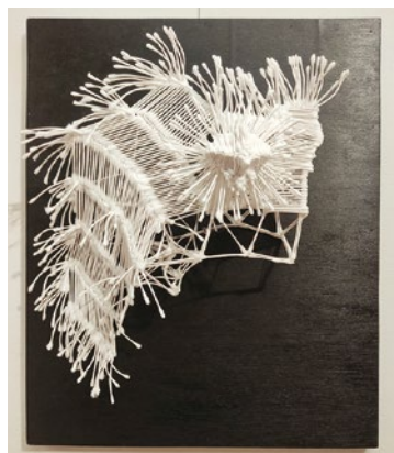
褒状を受賞した大作

毎年、芸術の秋10月に県展と並んで開催される障害者美術展「スピリットアート展」が去る10月3日より12日まで開催されました。県内の身体、知的、