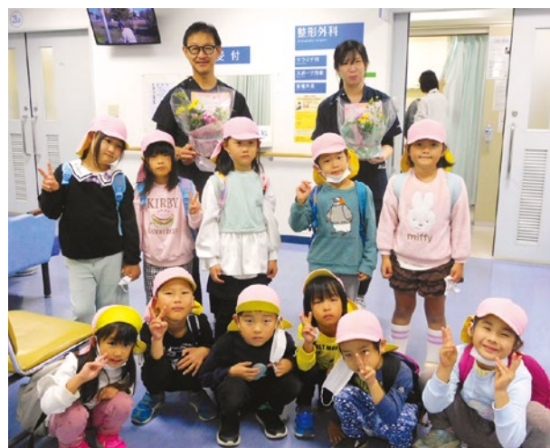
園児と尾崎医局長（上段左）と中前医師で記念撮影