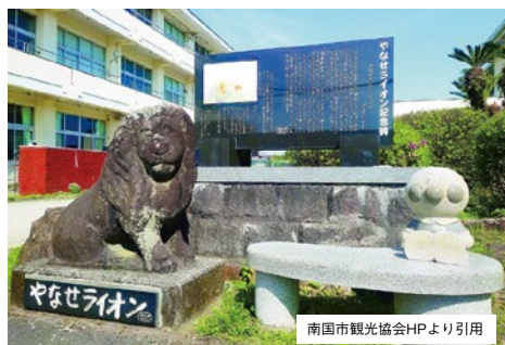
母校の後免野田小学校

口腔外科学講座に入り、途中1年3カ月、幡多郡大月町 にある大月診療所（現大月病院）歯科口腔外科への出向が ありましたが、約40年間高知大学医学部で勤務し、令