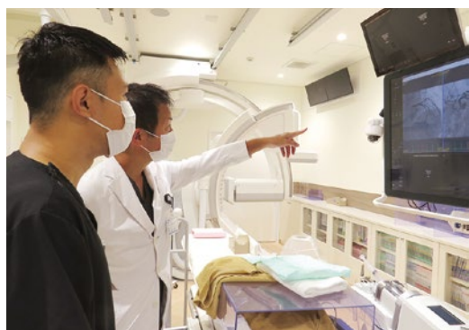
地域に根ざす新たな学びの場(研修イメージ)

がありました。特に連携施設の提携には苦労をしましたが、結果的にはより良い連携を築くことができました。