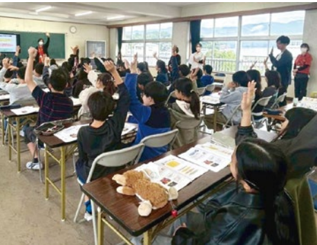
積極的な意見が飛び交う講座の様子

の3つのテーマで構成。さらに大塚製菓の協力により、認知症の「VR体験」を取り入れ、講義・クイズ・体験を組み合わせた分かりやすいプログラムとな