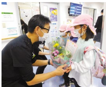
先生！いつもありがとう

勤労感謝の日に合わせて、小高坂双葉園年長組の元気な園児たちが細木病院を訪問。「いつもありがとう！おしごとがんばってね」のメッセージと感謝の花束が、外科尾崎医局長と整形外科中前医師に贈られました。いただいた花束は外来受付に飾らせていただきました。 (人事総務部広報課 安田貴彦)