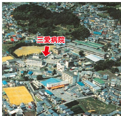
三愛病院界隈（昭和59年空撮）