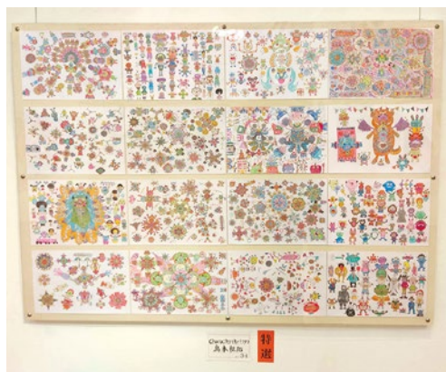
特選を受賞した力作