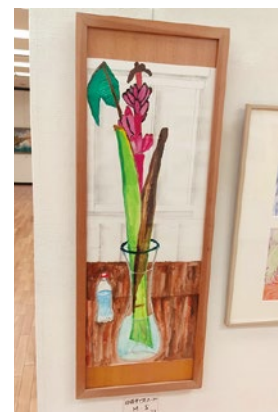
「日曜市で買ったバナナ」M・S