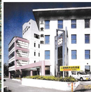
三愛病院のシンボルソーラー時計