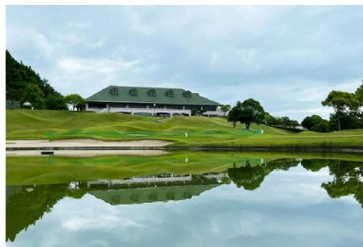
グリーンフィールゴルフ倶楽部（日高村）

11月3日（文化の日）にグリーンフィールゴルフ倶 楽部において、仁生会ゴルフコンペが開催されました。 仁生会職員および関係者16名が参加され、爽やかな秋 晴れのもと、皆さん和気あいあいとゴルフを楽しむこ とができました。私は今回初めて仁生会ゴルフコンペ