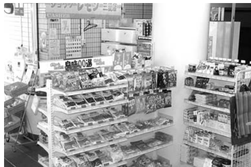
三愛病院 売店「レモン 三愛店」