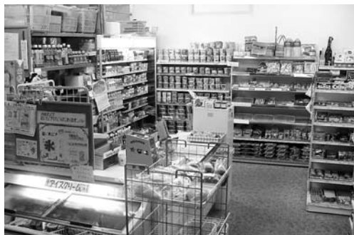
細木病院 売店「レモン」