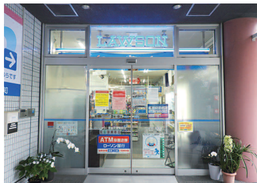
ローソンサテライト三愛病院店