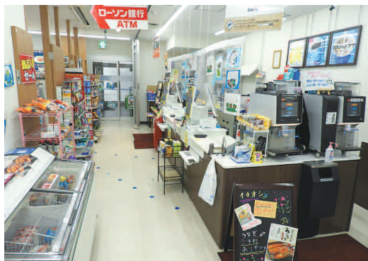
ローソン細木病院店内