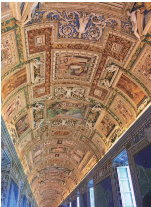
バチカン美術館の「地図の間」の天井画

2千年前の建造物の圧倒的な迫力に感動し、バチカン美術館では、システリーナ礼拝堂にあるミケランジェロの「最後の審判」の見事さにはしばらく見とれてしまいました。