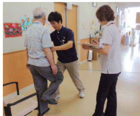
6月22日に「デイサービスいちご学校」で実施した理学療法士による体力測定&運動指導

『デイサービスいちご学校』では、1階の交流スペースを活用し、デイの利用者さんと地域の方が一緒