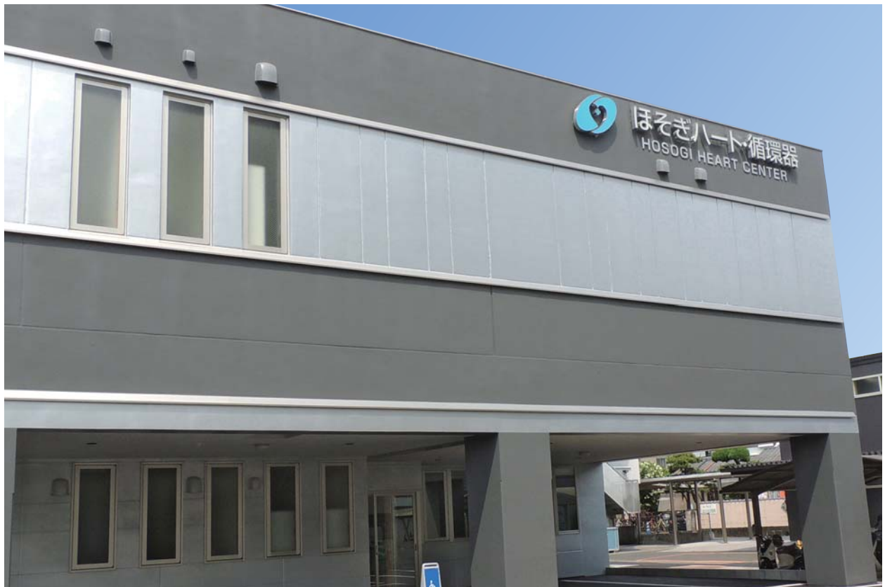
ほそぎハートセンター 2020年6月開設